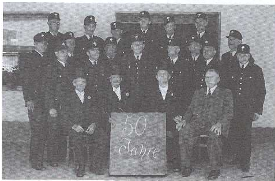
1952: 50 Jahre Freiwillige Feuerwehr Alfter

Als im Herbst 1959 das Vorgebirge von einer langanhaltenden Dürre betroffen war und für das reichlich angebaute Wintergemüse kaum noch Hoffnung bestand, schaltete sich die Alfterer Feuerwehr helfend ein. Wie schon einmal vorher, wurde eine Motorspritze eingesetzt, die am unteren Stühleshof aus dem gestauten Mühlenbach die Fässer der Landwirte mit Wasser füllte. Besonders am späten Nachmittag standen die Landwirte hier mit ihren Fahrzeugen "Schlange".